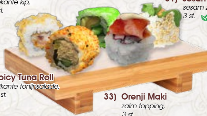
32) Spicy Tuna Roll pikante tonijnsalade, 3 st.