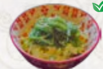
56) Zeewier Salade