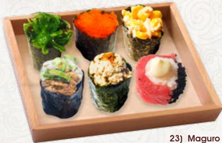
21) Gyu Gunkan beef