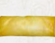
75) Kip Loempia