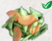
67) Roerbak Groente