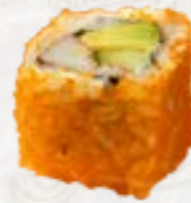
24) California Maki gedraaid met viskuit, 3 st.