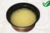
52) Miso Soep Japanse groenten bouillon