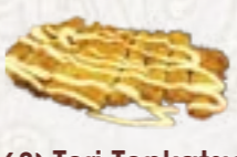
68) Tori Tonkatsu gefrituurde kip