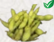
63) Edamame sojabonen