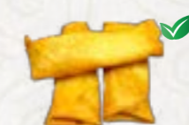
76) Mini Loempia's