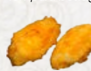
74) Tebasaki kippenvleugels