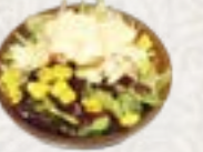
55) Mais Salade krab