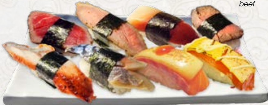
13) Unagi gerookte paling