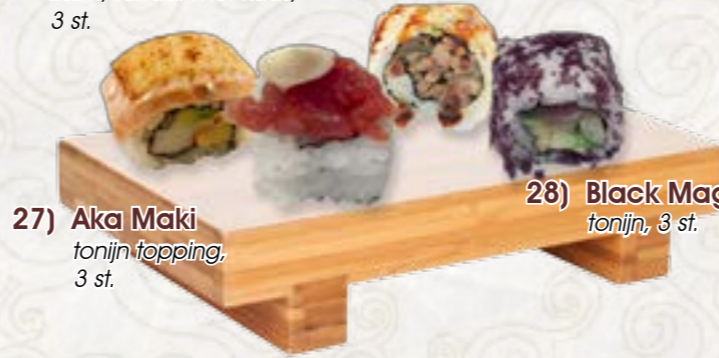
27) Aka Maki tonijn topping, 3 st.