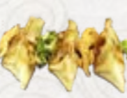
61) Gyoza pasteltjes