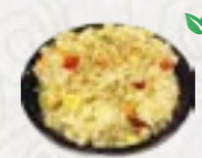
65) Yaki Meshi gebakken rijst