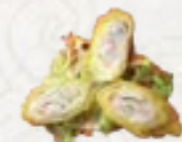
77) Ebi Loempia