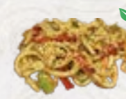
66) Yaki Udon gebakken noodles