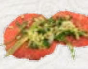
58) Gyu Saki carpaccio