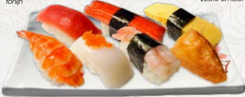
5) Ebi gek. garnaal