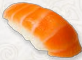
1) Sake zalm