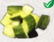
59) Cumcumber Tsukemono zoet zure komkommer