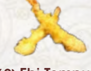
69) Ebi Tempura garnalen in tempura beslag