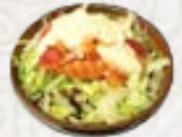
54) Sashimi Salad zalm, tonijn