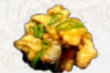
72) Zalm in zoetzure saus