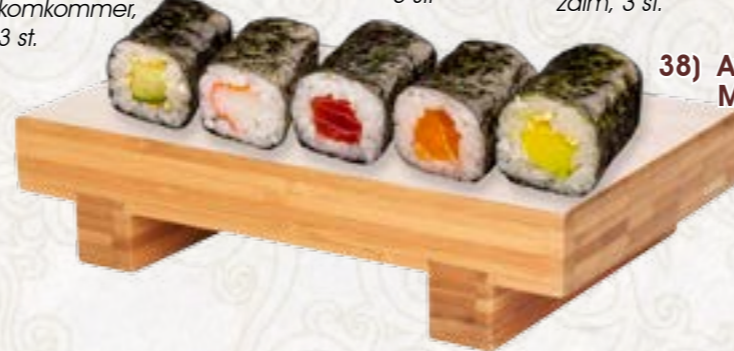
38) Avocado Maki 3 st.