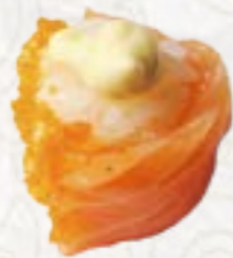
17) Sake Tobiko