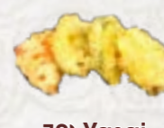
70) Yasai Tempura div. groenten in tempura beslag