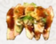
57) Kamo Niku koud, gegrilde eendenborstfilet