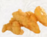
73) Citroen Vis